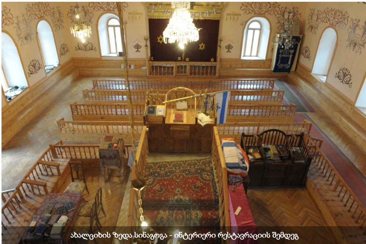
ახალციხის ზედა სინაგოგა - ინტერიერი რესტავრაციის შემდეგ

ზედა სინაგოგა აშენებულია 1863 წელს. მას მინიჭებული აქვს კულტურული მემკვიდრეობის ძეგლის სტატუსი 6 და საქართველოში დღემდე შემორჩენილ სინაგოგებს შორის ყველაზე ძველია. 2012 წელს, რაბათის რეკონსტრუქციისას, რესტავრაცია ჩაუტარდა ამ სინაგოგასაც, რა დროსაც ზეთის საღებავებისგან მთლიანად გაიწმინდა ხის ელემენტები, აღდგა მხატვრობის დაზიანებული ნაწილები.