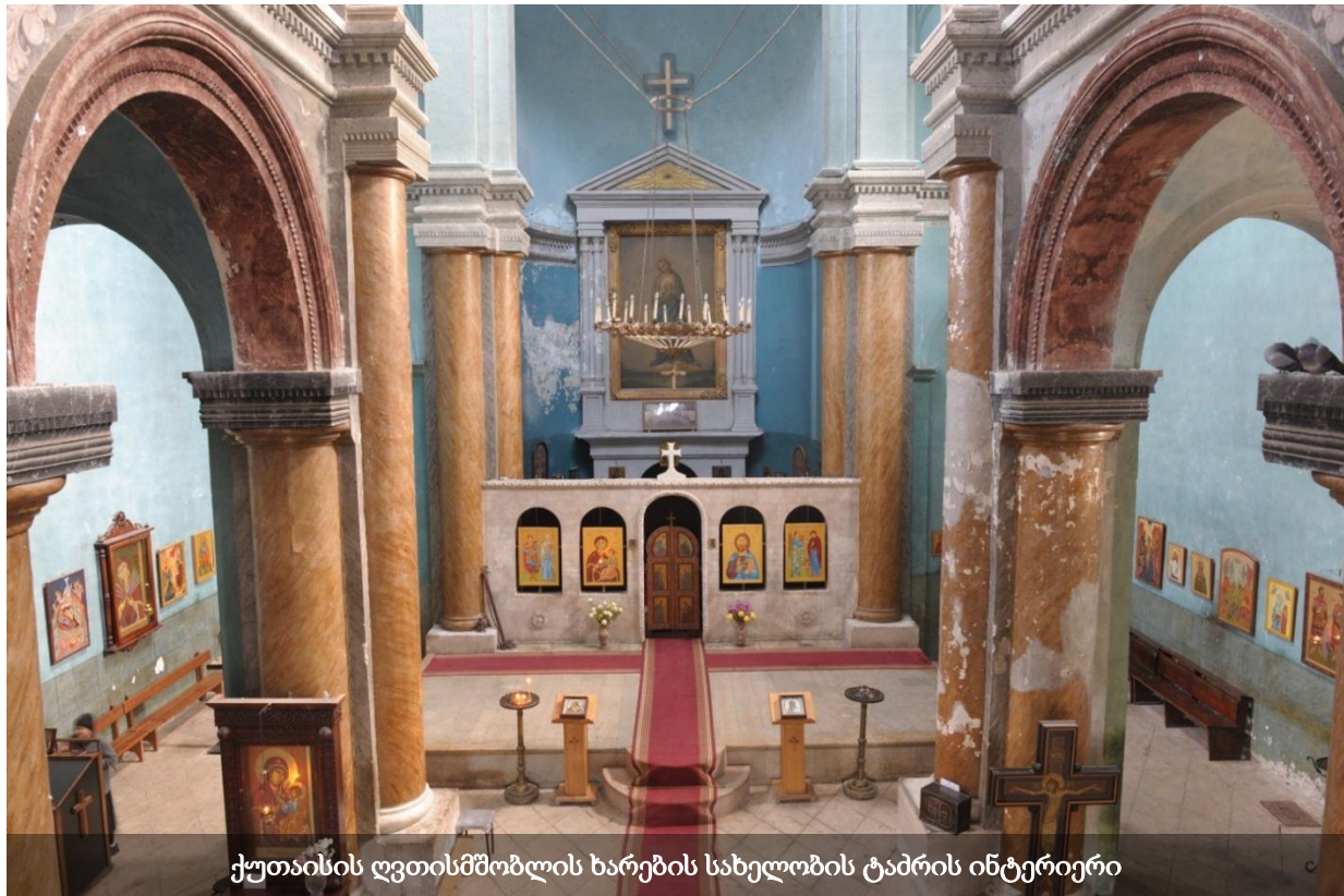
ქუთაისის ღვთისმშობლის ხარების სახელობის ტაძრის ინტერიერი