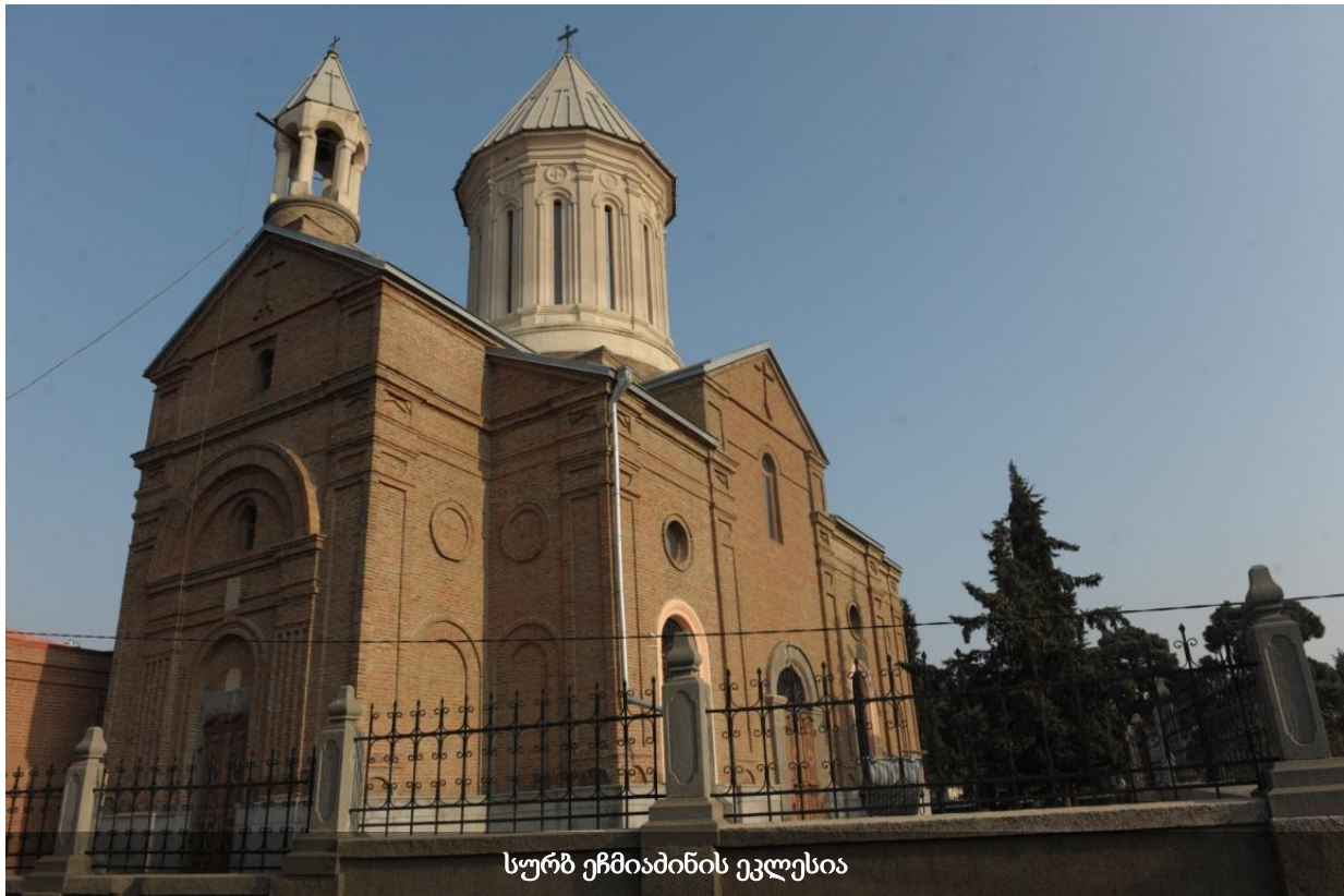
სურბ ეჩმიაძინის ეკლესია

საქართველოში სომეხთა სამოციქულო წმინდა ეკლესიის საქართველოს ეპარქიის რამდენიმე ათეული მოქმედი ტაძარია, პატარა სამლოცველოების ჩათვლით. 1930-იან წლებამდე ტაძრები სომეხი მრევლის საკუთრებაში იყო, შემდეგ კი კომუნისტურმა მთავრობამ ჩამოართვა, როგორც სხვა კონფესიებს. მხოლოდ თბილისის ორ ტაძარში - სურბ ეჩმიაძინისა და სურბ გევორგის ტაძრებში შენარჩუნდა წირვა-ლოცვა. დღესდღეობით თბილისში მხოლოდ ეს ორი ტაძარია მოქმედი. ორივეს კულტურული მემკვიდრეობის ძეგლის სტატუსი აქვს მინიჭებული. მთავარ პრობლემად რჩება საკუთრების საკითხი - სომეხთა სამოციქულო ეპარქიას ტაძრები სარგებლობის უფლებითაც არ გადასცემია.