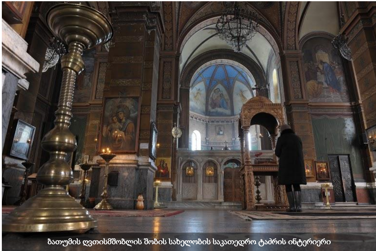
ბათუმის ღვთისმშობლის შობის სახელობის საკათედრო ტაძრის ინტერიერი

კუთვნილების საკითხი აუცილებელია, შესაბამისმა რელიგიური კონფესიის წარმომადგენლებმა კომისიას მიმართონ 25 .