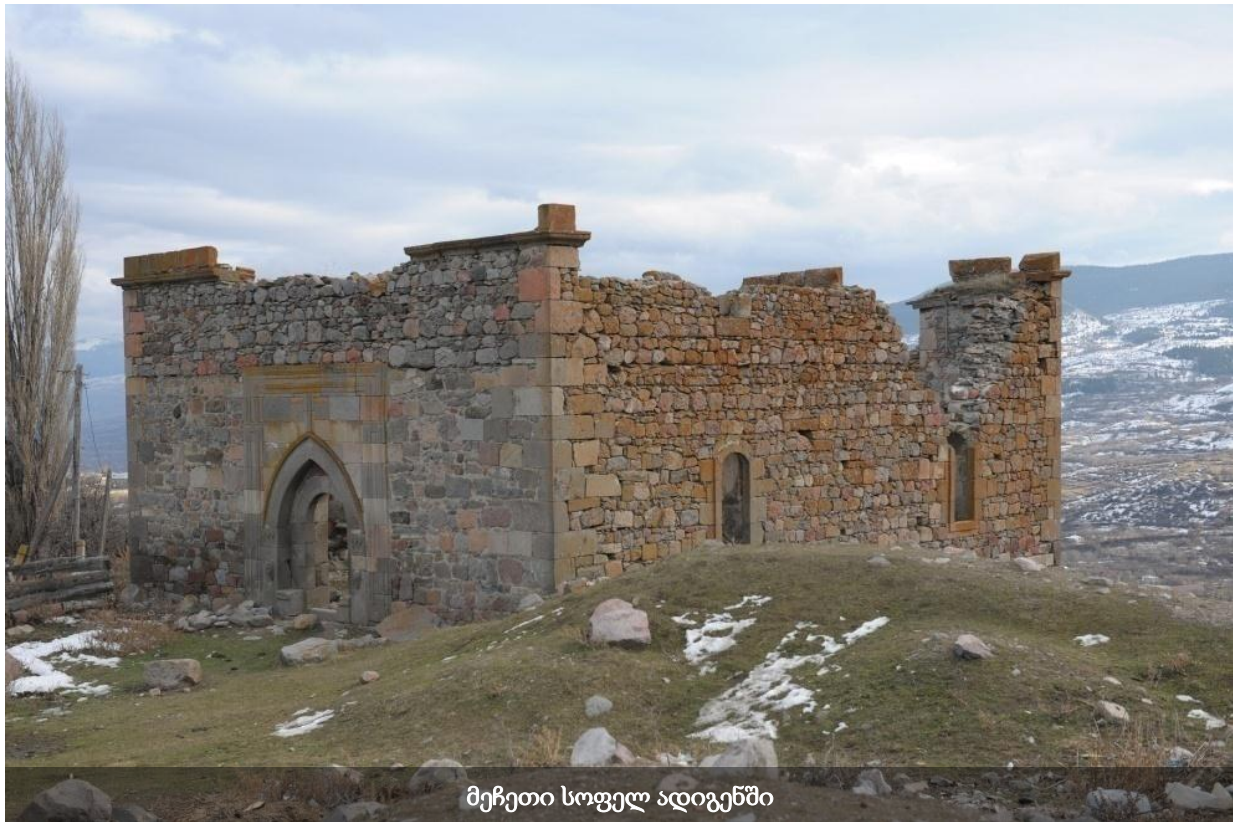
მეჩეთი სოფელ ადიგენში

დღეს ადიგენის მეჩეთის მხოლოდ კედლებია შემორჩენილი. ძლიერი დაზიანების მიუხედავად, შენობას კონსტრუქციული სიმყარე არ დაუკარგავს. კულტურული მემკვიდრეობის ექსპერტის შეფასებით, შემორჩენილი ნანგრევები იძლევა საშუალებას, შედგეს სრული ან ნაწილობრივი რესტავრაციისა და კონსერვაციის პროექტი.