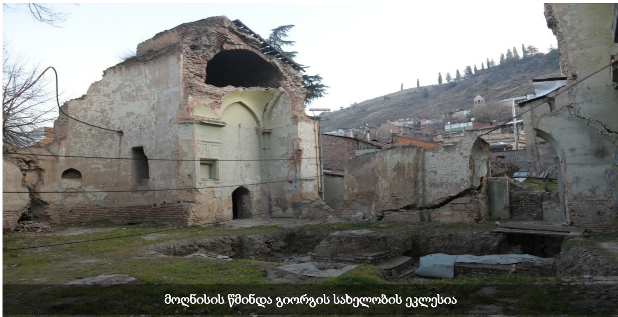
მოღნისის წმინდა გიორგის სახელობის ეკლესია

ეკლესია წარმოადგენს კულტურული მემკვიდრეობის ძეგლს. შესაბამისი სტატუსი მიენიჭა 2007 წელს. მიუხედავად ამისა, ტაძარი სავალალო მდგომარეობაშია. ძველი საფლავის ქვები გამოტანილია ქუჩაში, რის გამოც არსებობს მათი განადგურების ან დაკარგვის რეალური საფრთხე. ბოლო ხანებში ტაძრის ჩამონგრეულ ადგილებში დამონტაჟდა რკინის ბადეები, მაგრამ ეს არაა საკმარისი მოღნისის შესანარჩუნებლად. სომეხთა სამოციქულო წმინდა ეკლესიის საქართველოს ეპარქიის ცნობით, მრავალი გაფრთხილების მიუხედავად, სახელმწიფო აღნიშნული ეკლესიის რეაბილიტაციას ჯერჯერობით არ აპირებს.