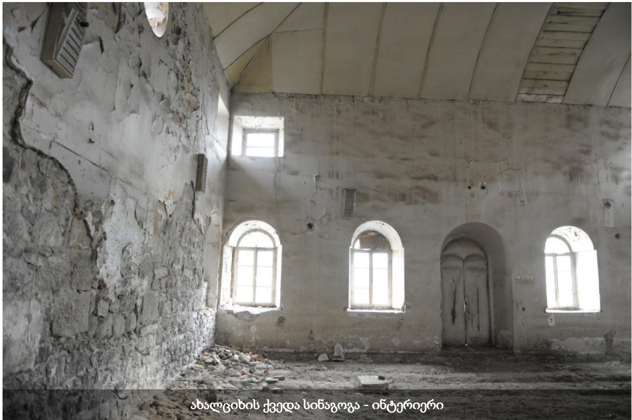
ახალციხის ქვედა სინაგოგა - ინტერიერი

ქვედა სინაგოგა 7 1902 წელსაა აშენებული. საბჭოთა კავშირის დროს აქ სხვადასხვა დაწესებულება იყო განთავსებული: ბიბლიოთეკა, კინოკლუბი, საბილიარდო... ბოლოს კი კრივის დარბაზად გამოიყენებოდა. მიუხედავად იმისა, რომ შენობა კონსტრუქციულად კარგ მდგომარეობაშია, ამჟამად სრულიად მიუხედავი და მიტოვებულია. სინაგოგის ფასადებსა და სახურავზე გაზრდილია ხე-მცენარეები, სახურავი კი მოძველებულია. გასარემონტებელია და მოუვლელია სინაგოგის ინტერიერიც, სადაც მთლიანად აყრილია იატაკი. მოკრივეთა გაყვანის შემდეგ მთავრობას სურდა, სინაგოგის რეაბილიტაცია, მაგრამ სამუშაოები არ ჩატარებულა. ახალციხის რაბათის რეაბილიტაციის დროს დაგეგმილი იყო არა მხოლოდ ამ კონკრეტული შენობის, არამედ მთლიანად ქვედა რაბათის უბნის რეკონსტრუქცია-რეაბილიტაცია, მაგრამ 2012 წლის შემდგომ სამუშაოები შეჩერდა. კულტურული მემკვიდრეობის დაცვის ეროვნული სააგენტოს ინფორმაციით, ახლო მომავალში ძეგლის რეაბილიტაცია არ იგეგმება.