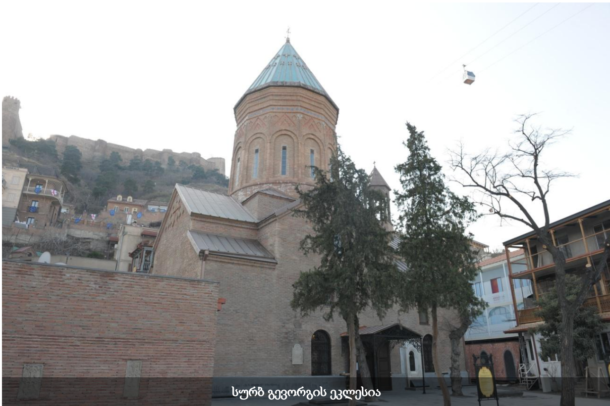
სურბ გევორგის ეკლესია

„სურბ გევორგის“ საკათედრო ტაძრის უკანასკნელი რესტავრაცია-რეაბილიტაცია 2012 წელს დაიწყო. საპროექტო-კვლევითი სამუშაოები და რეაბილიტაცია ეტაპობრივად ხორციელდებოდა. დღეისათვის სარესტავრაციო სამუშაოები, ფაქტობრივად, დასრულებულია. 2010 წელს სომეხთა სამოციქულო წმინდა ეკლესიის საქართველოს ეპარქიის დაკვეთით, შპს „ახალი საქალაქმშენპროექტის“ მიერ ჩატარდა საინჟინრო-გეოლოგიური კვლევა, 2012 წლის მანძილზე შედგა კონსტრუქციული გამაგრების, ფასადებისა და ინტერიერის კედლების რეაბილიტაციის პროექტი. შემდგომ წლებში კი ჩატარდა ფიზიკური სამუშაოები, რომლის დასრულებაც 2015 წელს საზეიმოდ აღინიშნა.