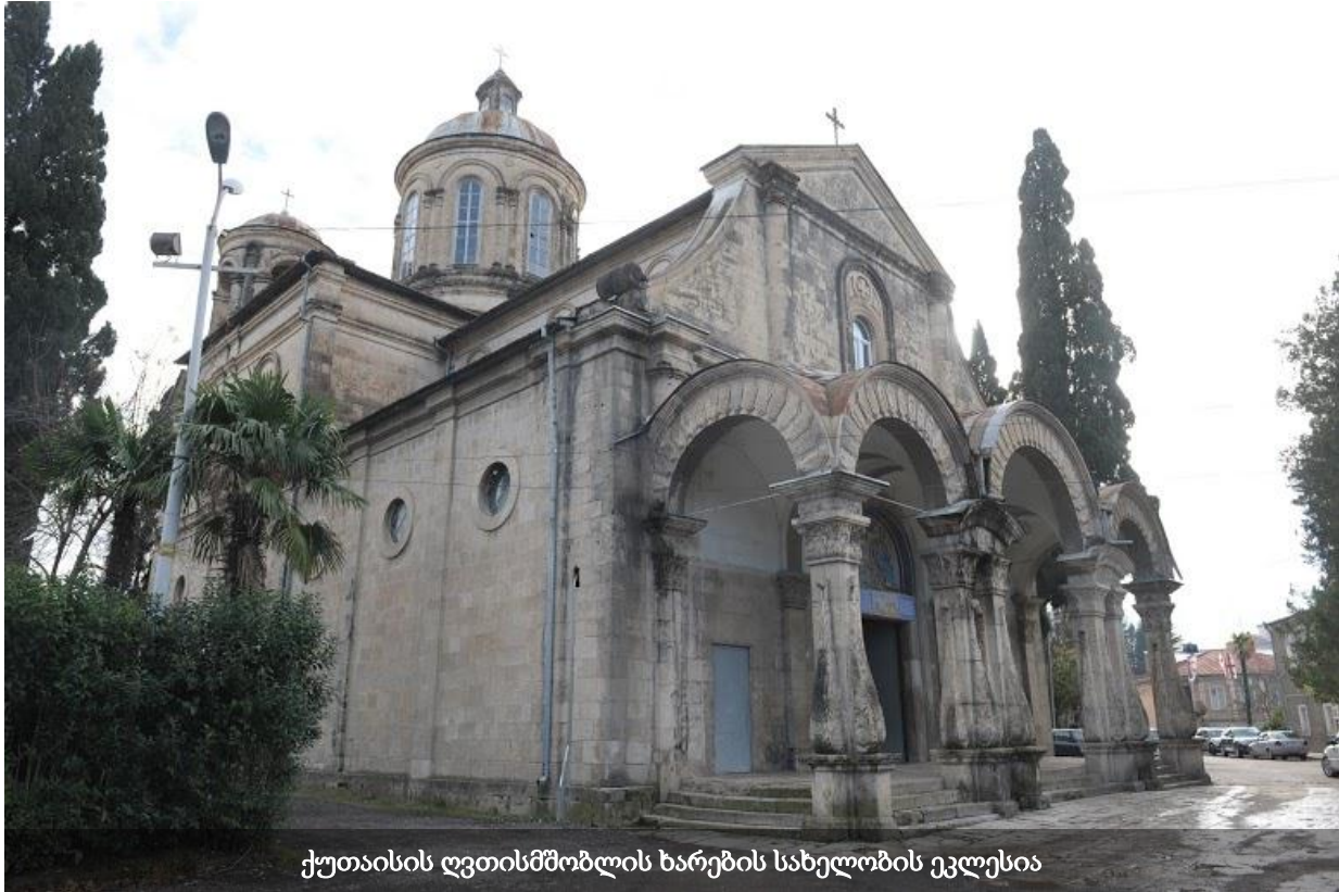
ქუთაისის ღვთისმშობლის ხარების სახელობის ეკლესია

დღეისათვის, ქუთაისის ღვთისმშობლის ხარების სახელობის ეკლესია რეგისტრირებულია საქართველოს საპატრიარქოს საკუთრებაში. კათოლიკეები აცხადებენ, რომ ეკლესია მათ, ფაქტობრივად, წაართვეს.